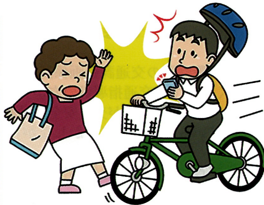
ながらスマホはしない！