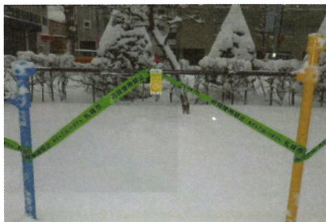
【安全確認が終わるまでの状態】