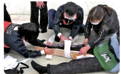
救急法の講習(救急法養成講習)