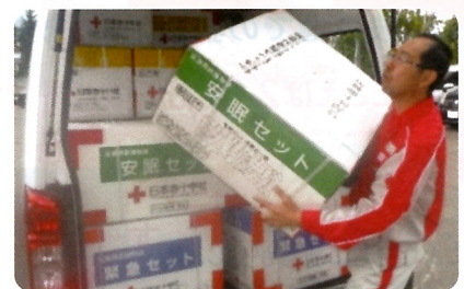
救援物資の搬入(胆振東部地震)

札幌市地区本部 令和4年度社資実績額 76,595,634円 (令和5年1月末現在)