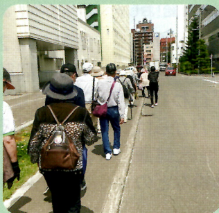
▲大通・西地区合同すこやか倶楽部のウォーキングのようす