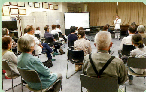
▲桑園地区すこやか倶楽部での医師による講話

ストレッチ運動や脳トレを行うこともあれば、管理栄養士、理学療法士、医師や薬剤師など専門の講師をお招きしての講座をすることもあります。参加費は無料ですので、ぜひお気軽にご参加ください。いつでもお待ちしております。地域の顔見知りができる場所にもなりますよ。