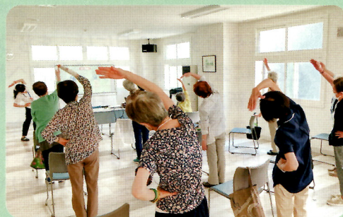
▲西創成地区すこやか倶楽部サッポロスマイル体操のようす

それ以外にも、老人クラブやふれあい・いきいきサロン、町内会の集まりなどに介護予防センター職員がお邪魔し、運動を一緒にしたり、介護予防の講座を開催したりすることも出来ます。「地域の通いの場」を一緒に作るお手伝いもいたしますので、ぜひお声がけください。