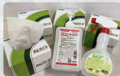
感染予防資材の提供(各区役所へ配付)