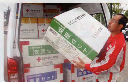
救援物資の搬入(胆振東部地震)